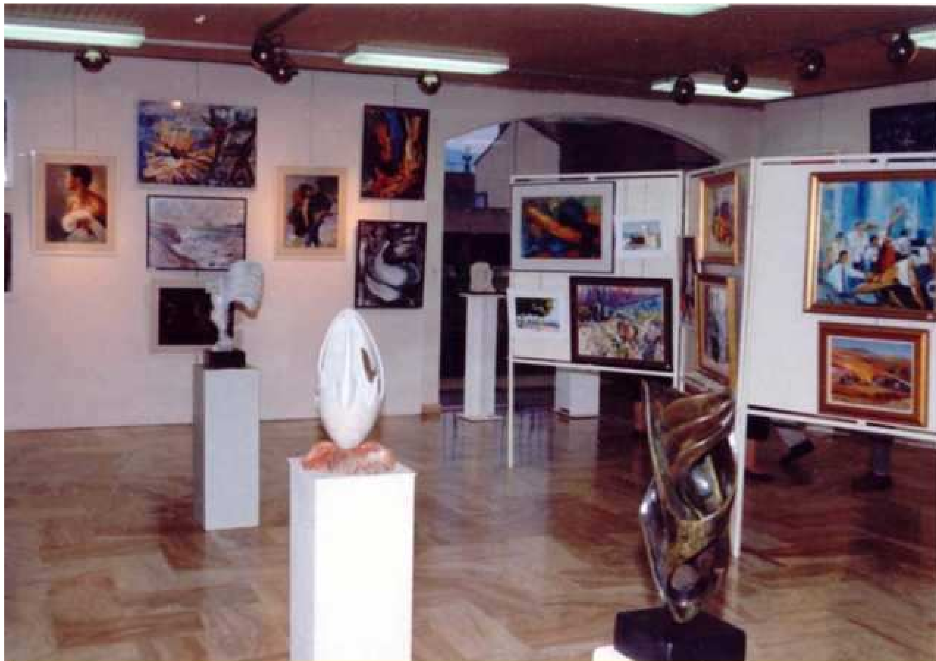
1994 XVIIème salon d'Arts Plastiques - Hôtel de Ville d'Elne