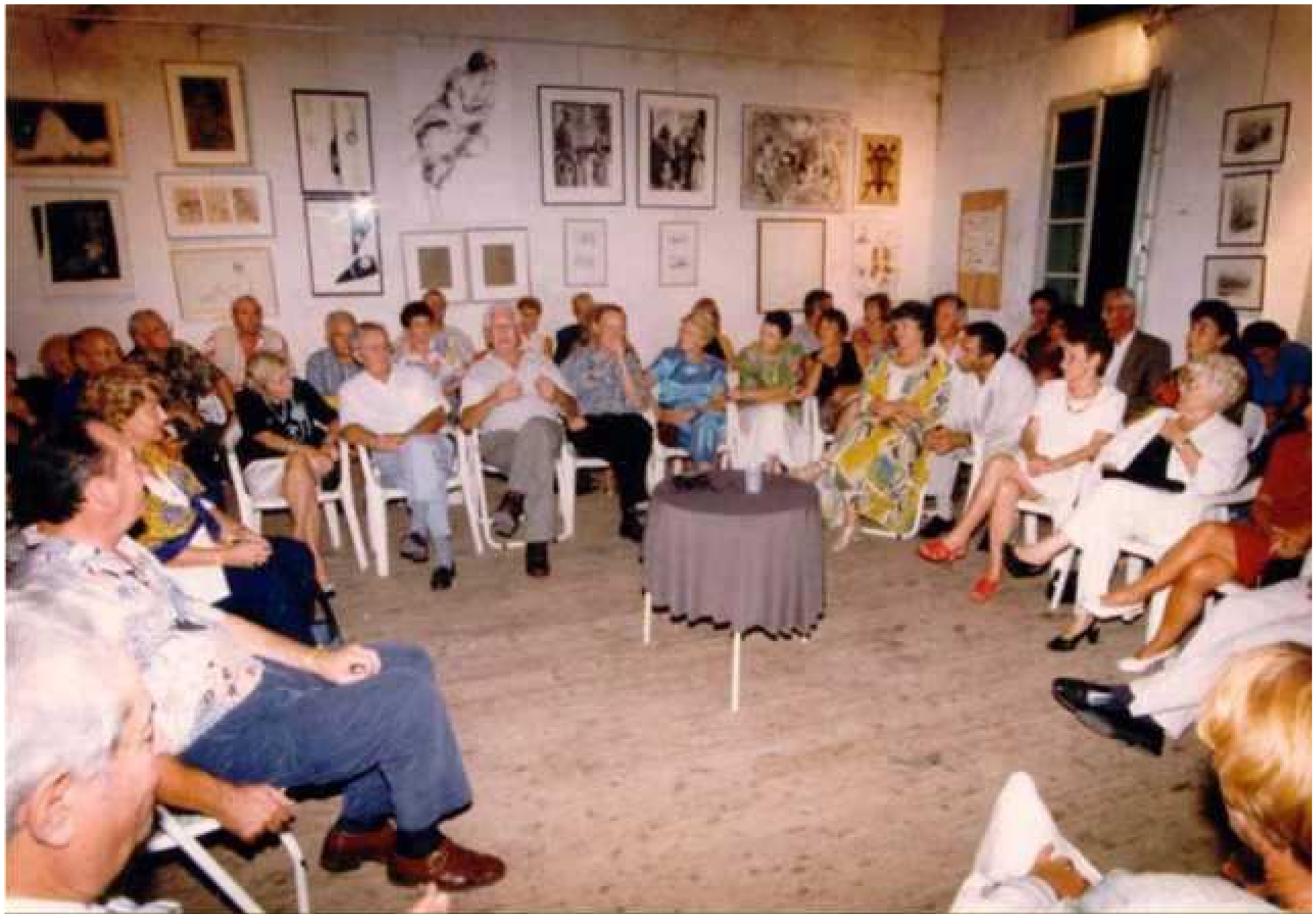
1997 soirée dessin par Jean Marc Treil