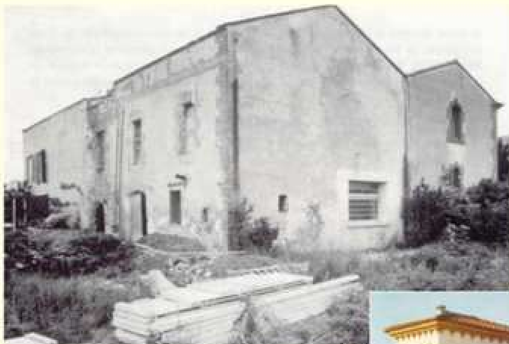
Du Mas Cargolès ...