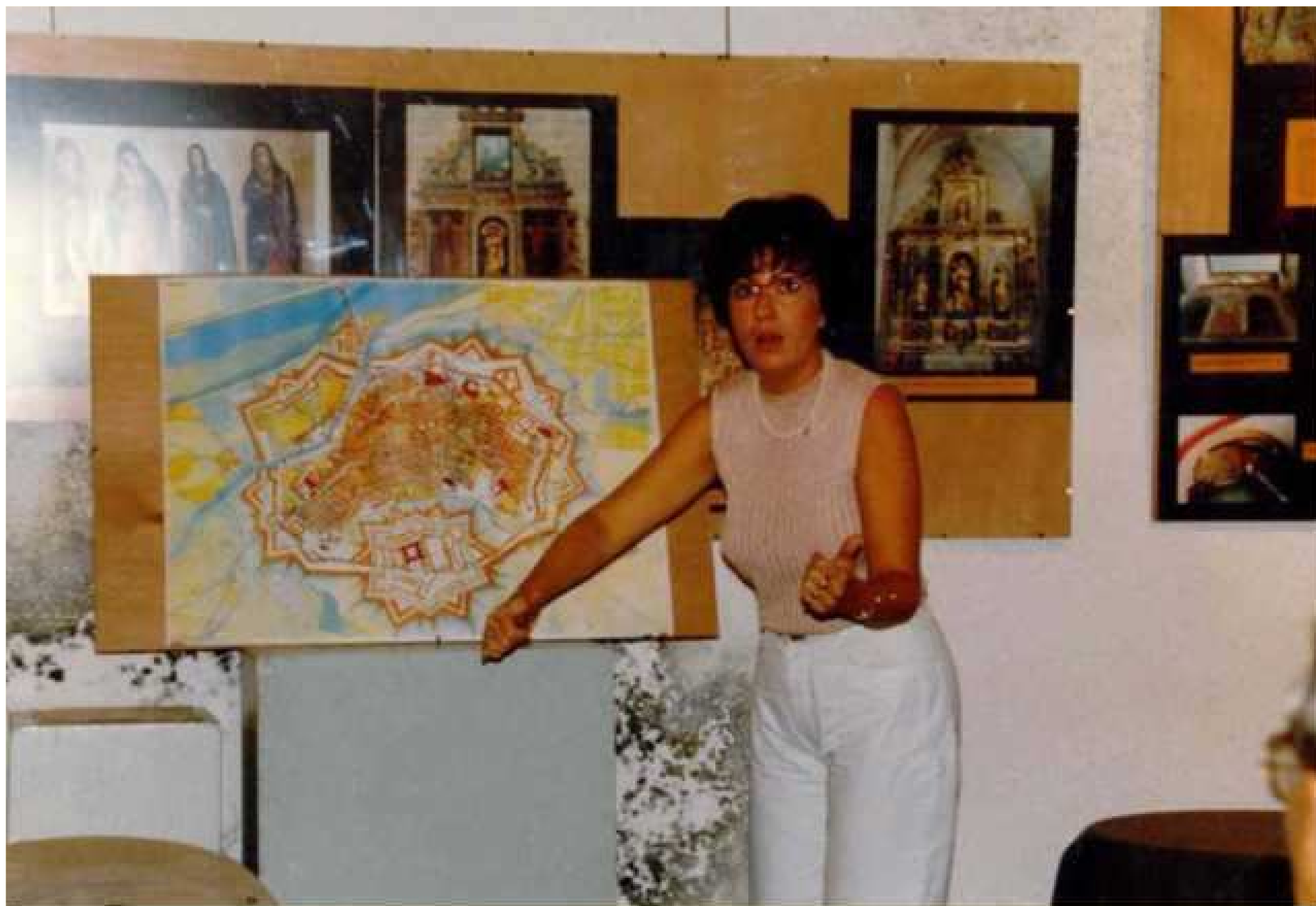
1996 les anciens couvents