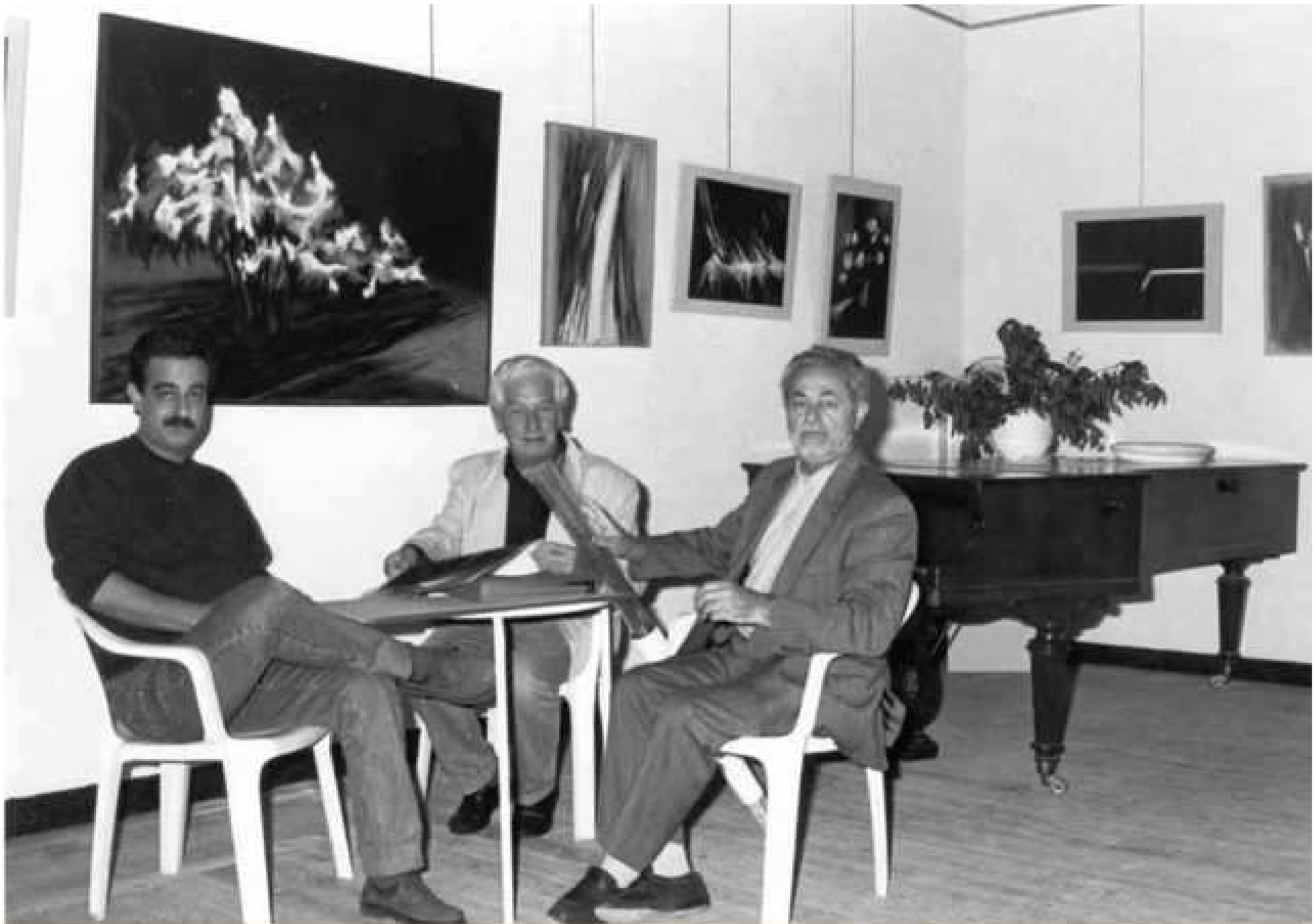
1992 le Grenier de Sant Vicens