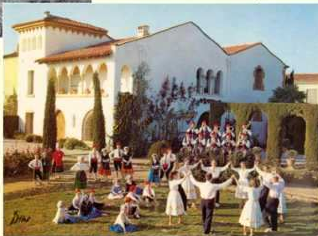
... à Sant Vicens