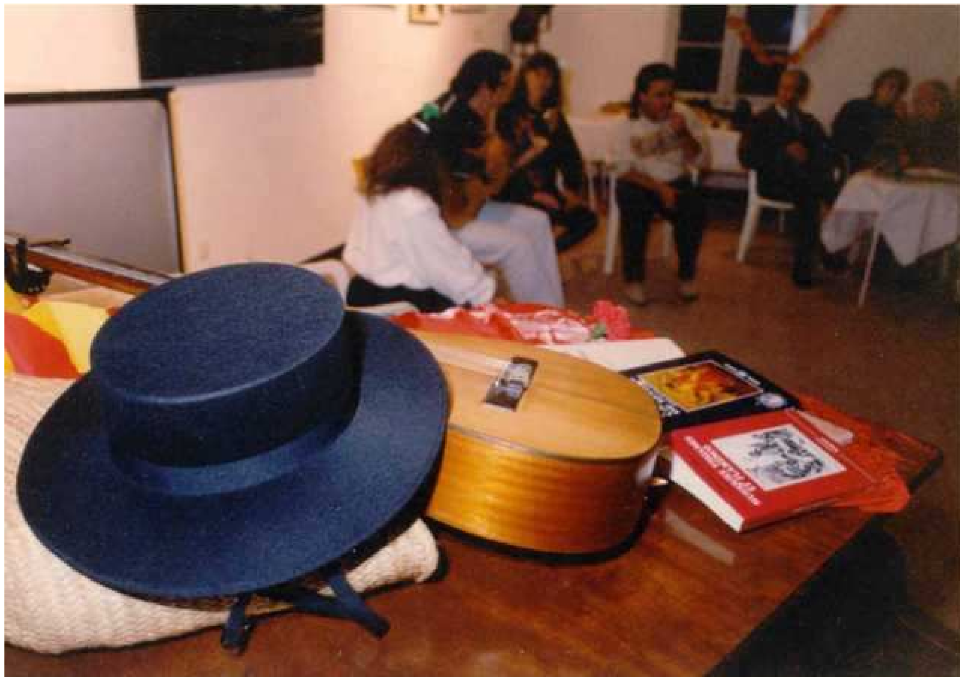
14 octobre 1992 Inauguration du Grenier de Sant Vicens – soirée Flamenco