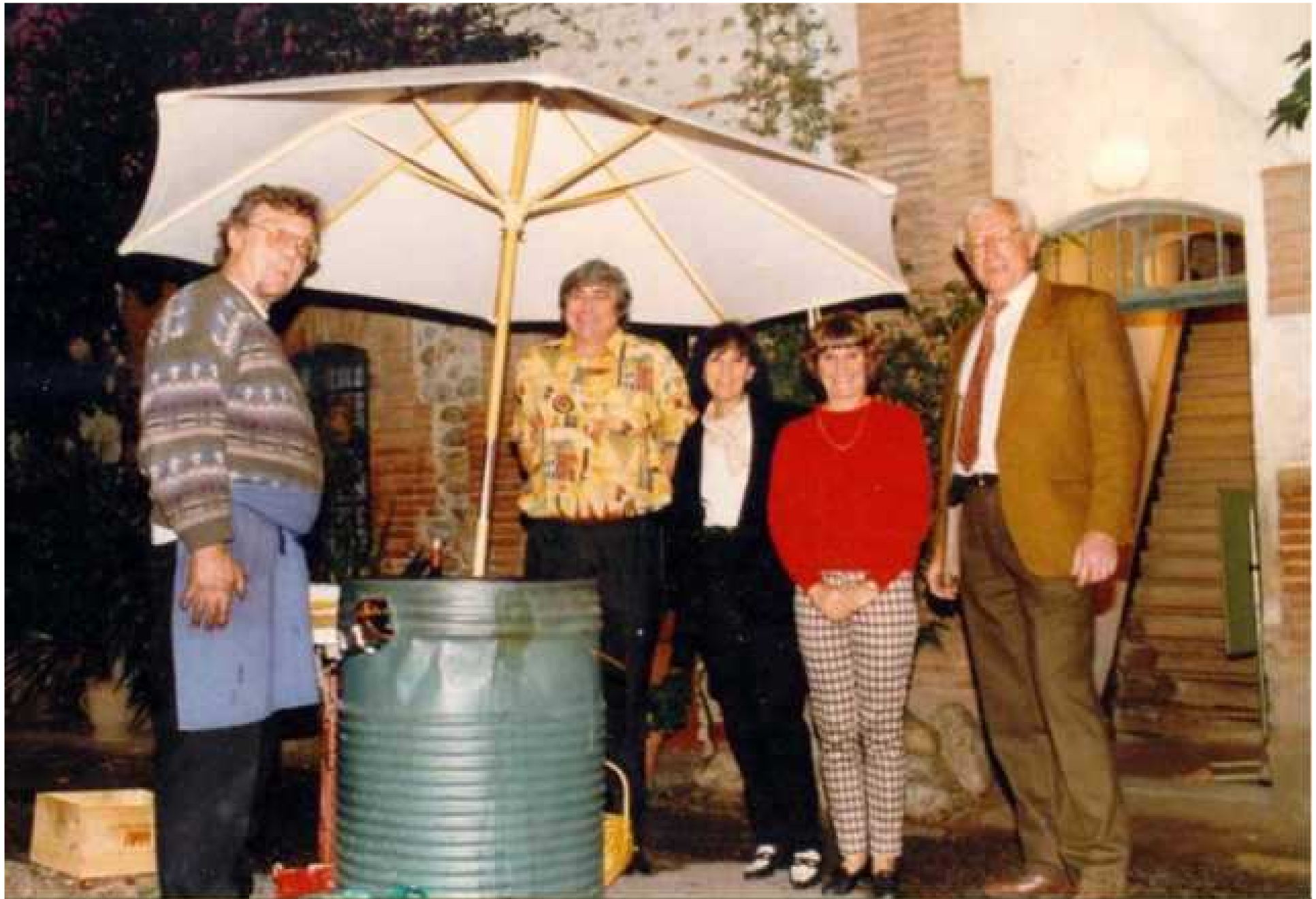
1996 castanyade et karaoké