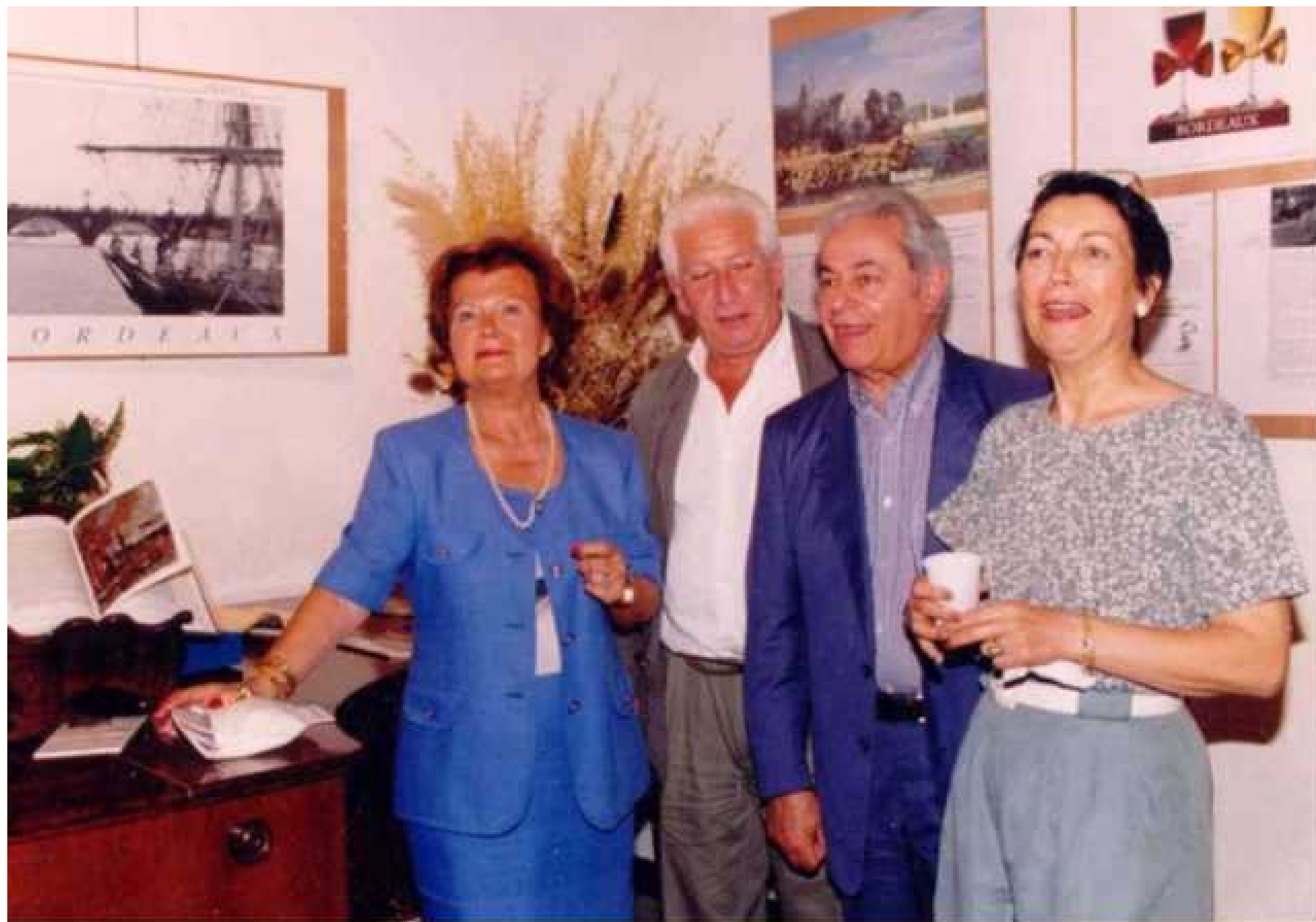
1998 Mauriac par Danièle Delclos